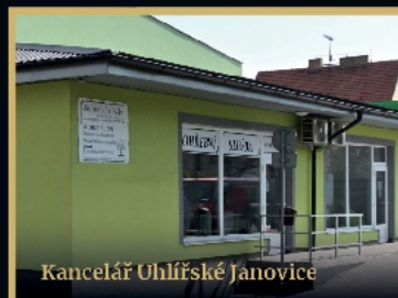
Kancelář Uhlířské Janovice