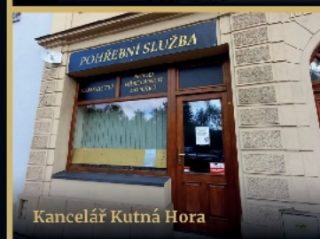
Kancelář Kutná Hora