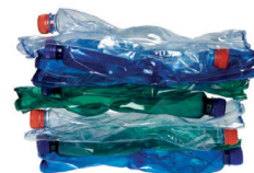
sešlapané PET lahve 10 ks